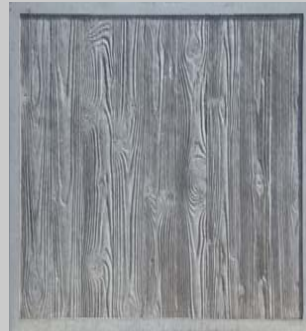
Strukturen sind mit oder ohne einen Rahmen aus Sichtbeton herstellbar.